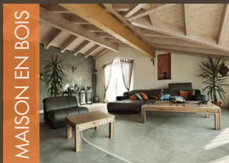
MAISON EN BOIS